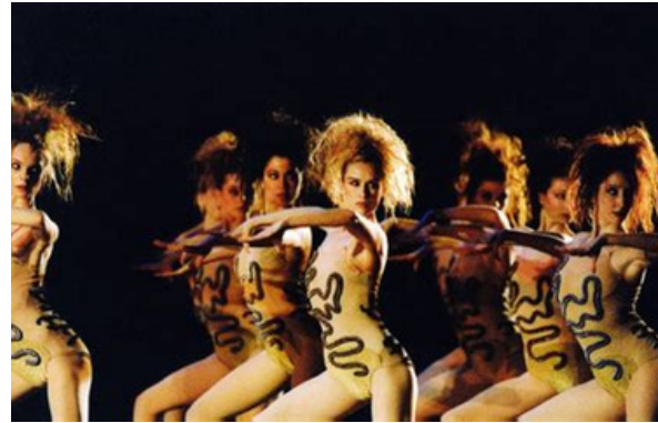
La Cage 1951