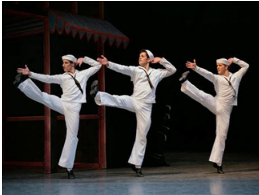
Fancy Free 1944