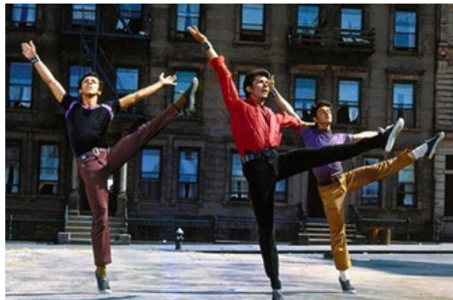
West Side Story 1957