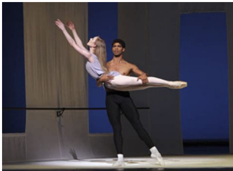
L'Après-midi d'un faune 1953