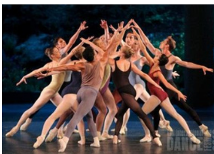
Moves 1959 (ballet sans musique)