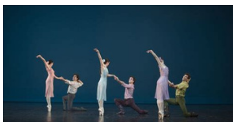
Dances at the Gathering 1969